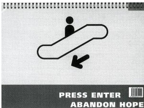
Achterflap van de theatertekst 'Kaufhaus'.

De namen Acheron, Styx en Charon lopen het beeld in en uit. Phlegyas is een liftboy, met ingeplugde stekker. Geryones, een hacker, lid van het Analogue Liberation Front (ALF), wil het Kaufhaus saboteren. [p. 286]